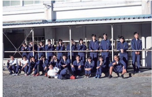
後期体育デー(3年生)

男子はサッカー、女子はバドミントンとバレーボールで競いました。試合の間や、昼休みなどにも練習する生徒が多く、思い切り体を動かして楽しみました。3年生にとっては最後の体育デー。終了後、学年で記念撮影をしました。