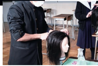
理美容の授業体験