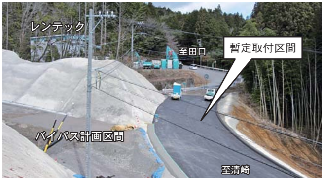
①国道257号 清崎 D2-2(安沢坂) ・現道の急カーブを緩和するため、約1kmのS字形の緩やかなカーブに道路を改修します。

工事中は、通行止めなどご迷惑・ご不便をおかけすることとなりますが、皆様のご理解・ご協力を引き続きよろしくお願いいたします。