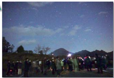
奥三河総合センター星空観察会の様子

町内にある以下の公共施設では、「奥三河☆星空の魅力を伝える会」の協力のもと、定期的に星空案内人による星空観察会を開催しています。また、野外学習中として小学生に星空教室を開催しています。