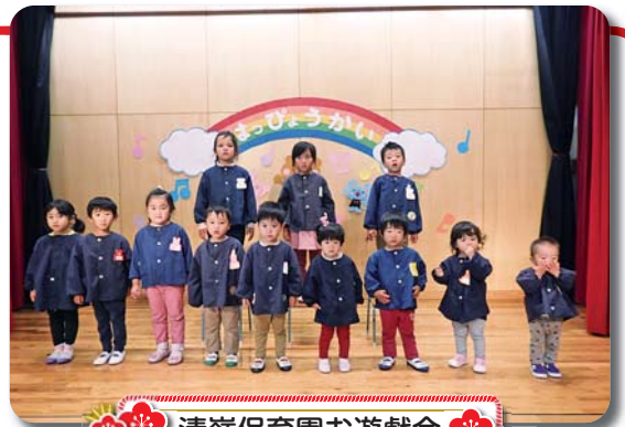
清嶺保育園お遊戯会

広報したら1月号の表紙で、名倉保育園の写真を清嶺保育園の写真として掲載しておりました。関係者の皆様に謹んでお詫び申し上げます。