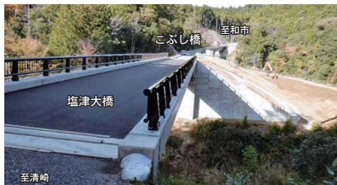
⑥和市清崎線 清崎 D22-2(塩津大橋) ・新しく野々瀬川に架かる塩津大橋が完成しました。続いて現行の塩津橋を架け替えます。