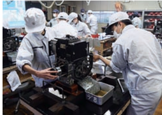
ディーゼルエンジンを分解している生徒

初日はディーゼルエンジンの分解、翌日はその組み立てとガソリンエンジンの分解と組み立て、3・4日目はトラクター、ホイールローダー、ドラグショベル、フォークリフトの運転、最終日は実習のまとめとなる筆記試験を行いました。