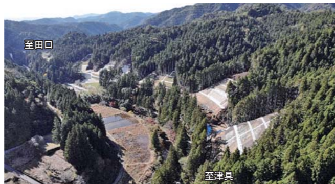
④設楽根羽線 八橋 D14 ・現道の設楽根羽線がダム完成時に水没するため、道路の付け替え工事を行っています。