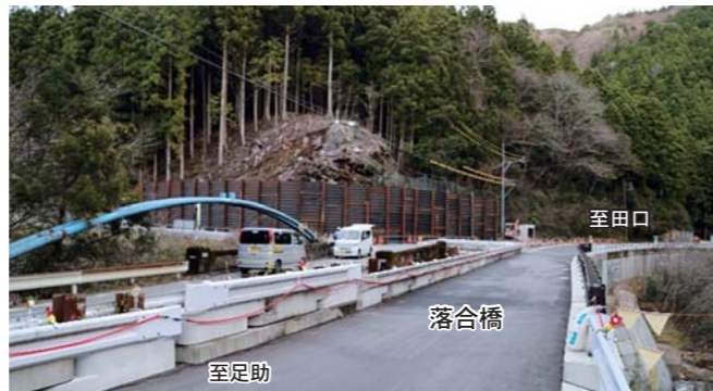
②国道420号 豊邦 D8(落合橋) ・1車線分の橋が完成しました。交通を切り替え、旧橋を撤去し、もう1車線分の橋を造ります。