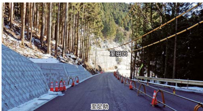
⑤瀬戸設楽線 東納庫 D17 ・1車線の道路を2車線に拡幅する工事を行っています。向こう側に清流公園があります。