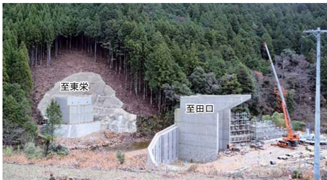
③国道473号 神田 D13(月バイパス) ・バイパス整備のために1号橋を建設中です。その後、東栄側とを結ぶトンネルを掘る予定です。