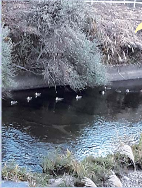
津具川に、カモが帰ってきました